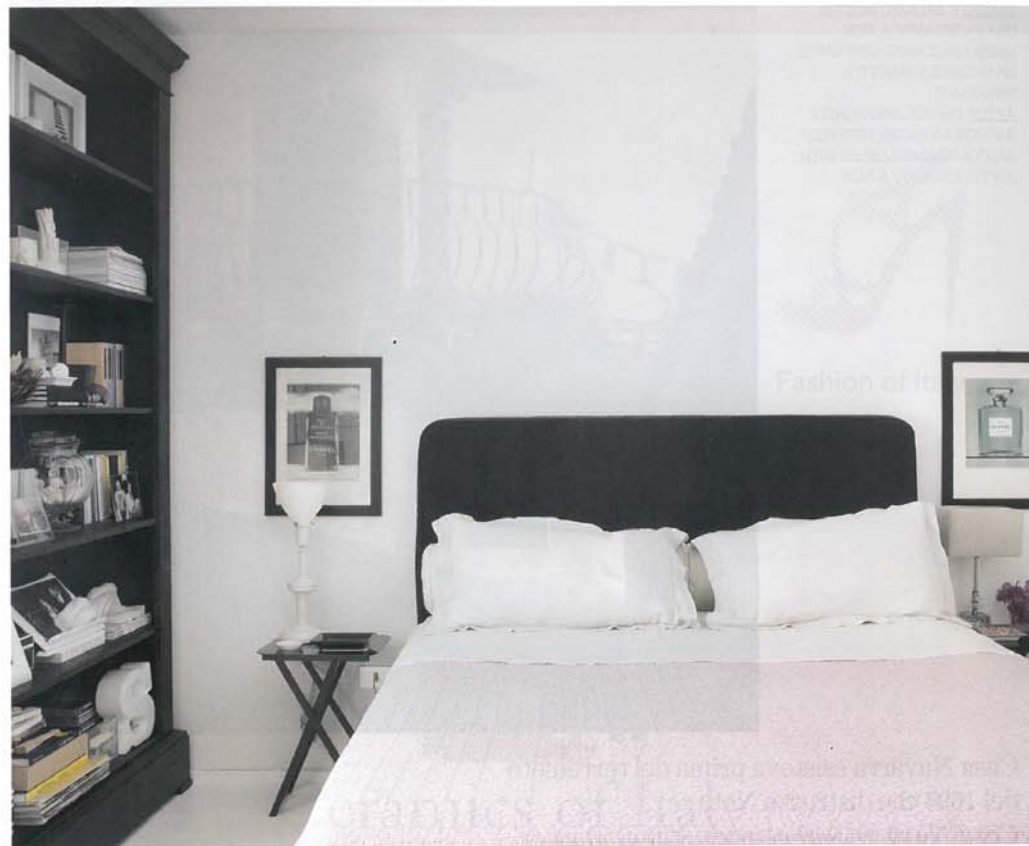
SOPRA LA CAMERA DA LETTO CON LAMPADE ANTICHE ABOVE THE BEDROOM WITH ANTIQUE LAMPS

familiari che, non seguendo alcun allineamento prestabilito, posarono le proprie "baracche" dopo il terremoto dando luogo a fenomeni di aggregazione spontanea. Il risultato è quello di un quartiere che ricorda il sistema delle casbe arabe, fatto di stretti vicoli, cortili, scale e rampe che nel tempo hanno assediato Casa Navarra. Essa, tuttavia, svetta ancora sulle case popolane con la sua maggiore altezza, mantenendo una facies antica, con ampie balconate amicchite da morbide e panciute inferriate, dalle quali si gode una vista privilegiata sulla campagna di Noto." L'intervento di restauro di casa Navarra ha puntato alla valorizzazione degli aspetti originari mantenendo intatti gli esterni. Il progetto dell'architetto Papa ha mirato a dare respiro e vigore agli spazi interni, sapientemente suddivisi in relazione alle aperture che consentono di godere di viste uniche, ora sul centro storico, ora sulla campagna da lì percepita come nel Settecento, ovvero natura separata dall'artificio barocco: da una parte il verde della campagna, dall'altra il giallo-oro della