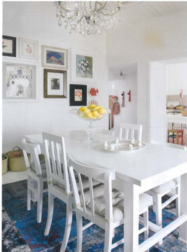
SOPRA, LA SALA DA PRANZO E ALLE PARETI IL QUADRO CHE RAFFIGURA IL PROSPETTO DELLA CASA E A DESTRA LA CUCINA. IN BASSO, DIPINTI E OGGETTI DI ANTIQUARIATO ACQUISTATI IN MERCATINI ITALIANI ED ESTERI ABOVE, THE DINING ROOM WITH A PAINTING DEPICTING THE PROSPECT OF THE HOUSE AND, RIGHT, THE KITCHEN. BELOW, PAINTINGS AND ANTIQUE OBJECTS BOUGHT AT MARKETS IN ITALY AND ABROAD

Modernariato e light design nell'illuminazione The lighting features modern antiques and light design